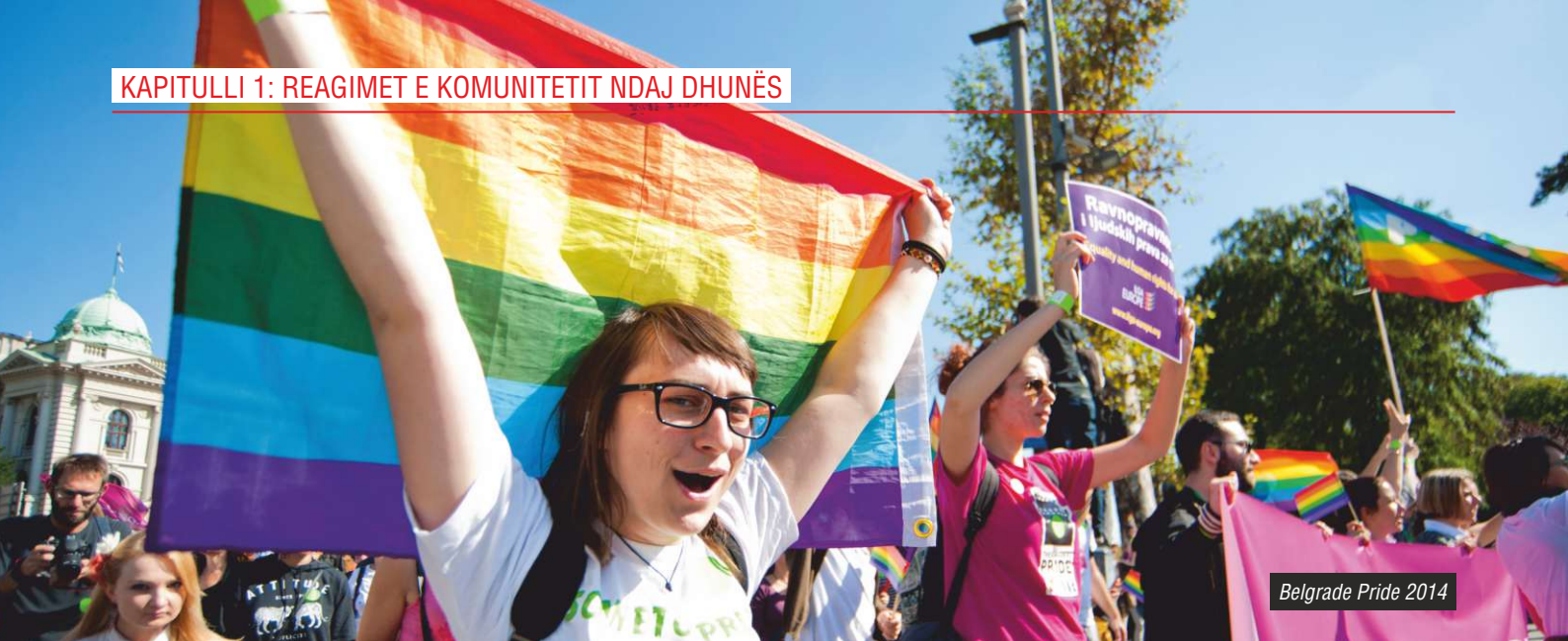
Belgrade Pride 2014