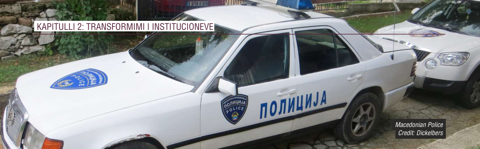
Macedonian Police