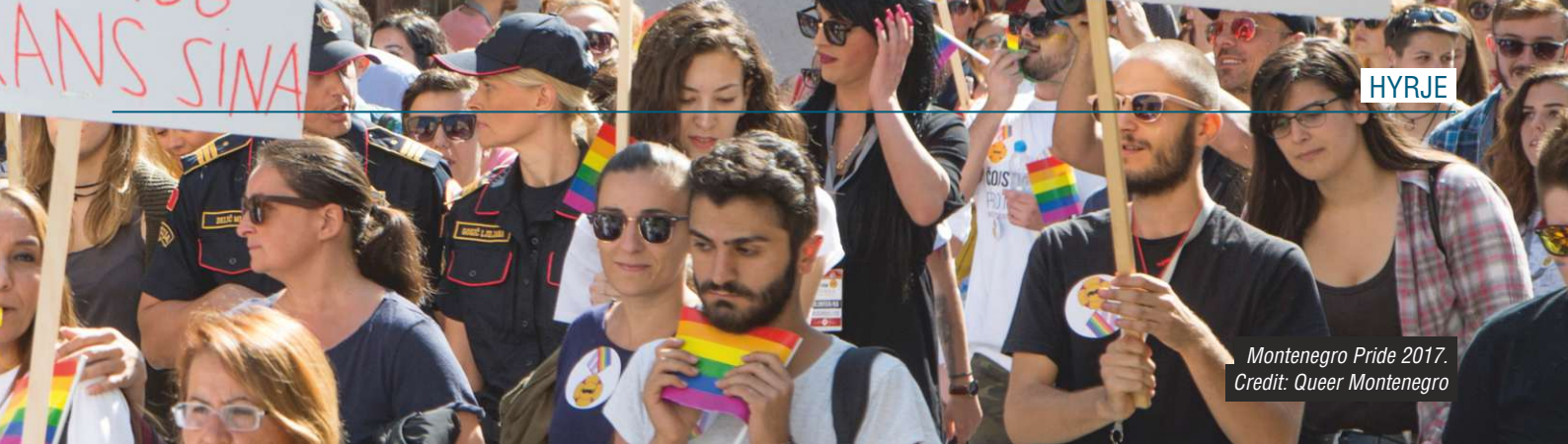
Montenegro Pride 2017.