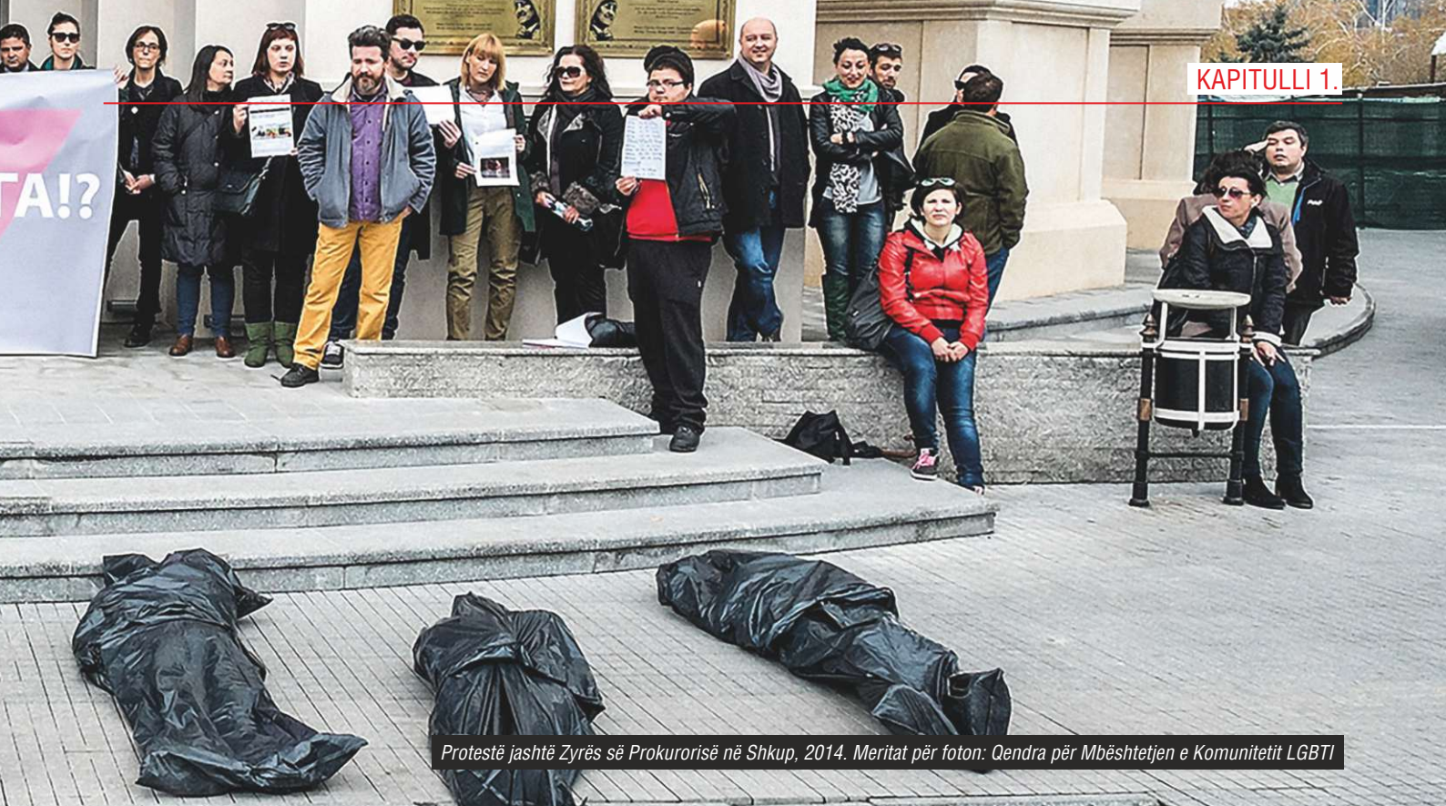
Protestë jashtë Zyrës së Prokurorisë në Shkup, 2014.