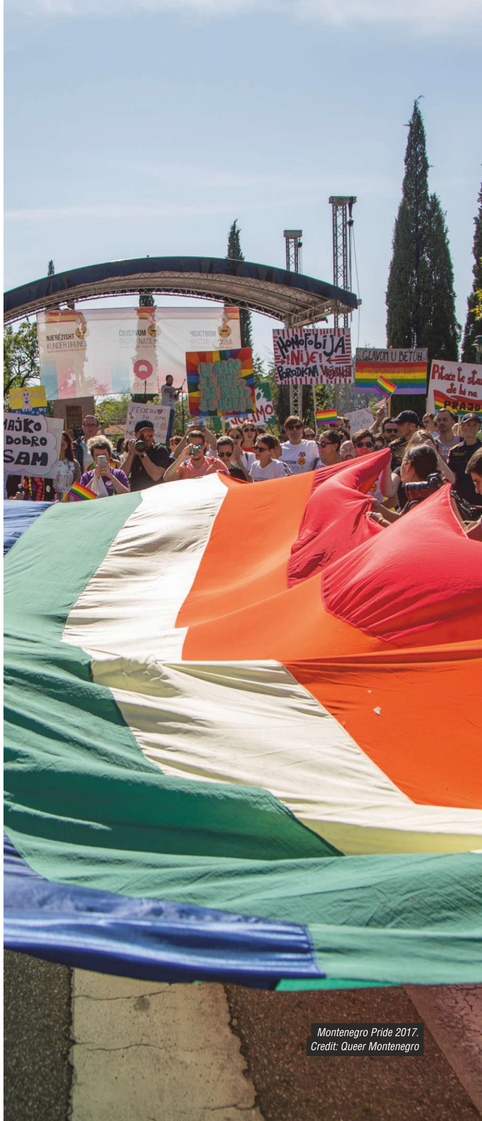
Montenegro Pride 2017.

rm.coe.int/prems-030717-gbr-2575-hate-crimes-against-lgbti-weba4/1680723b1d